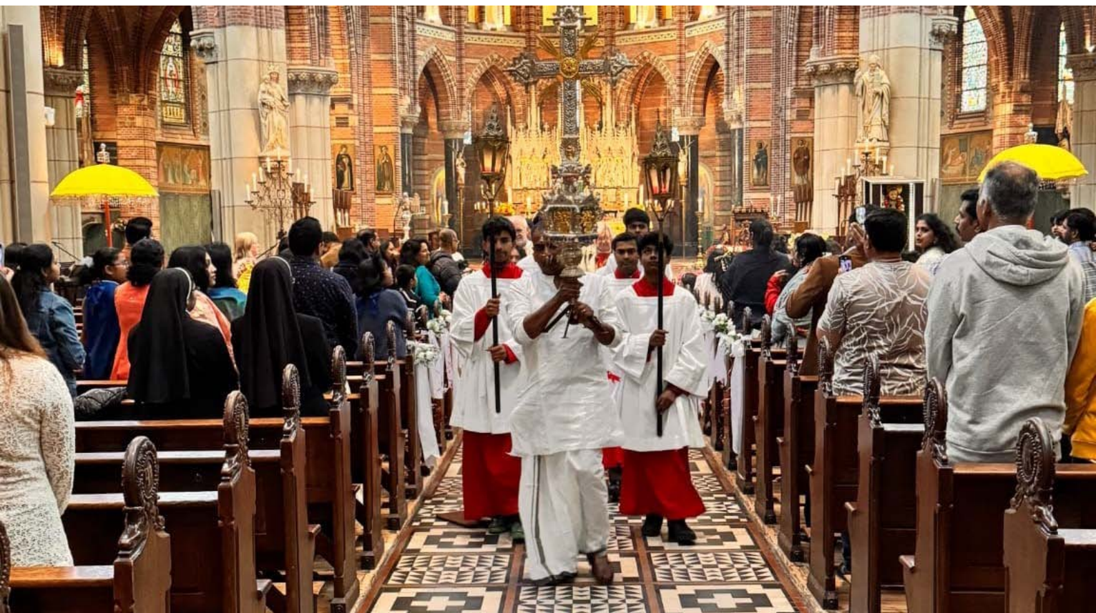
Processie ter gelegenheid van het parochiefeest van de Syro-Malabar christenen in Hilversum (2024)

Tijdens de Heiligdomsvaart in Maastricht kan de Syro-Malabar Kerk een unieke spirituele dimensie toevoegen. Op vrijdag 20 juni 2025 om 17.00 uur zal een groep vertegenwoordigers van deze kerk een gebedsdienst bij de noodkist begeleiden, en op zondag 22 juni om 12.00 uur zal de gemeenschap een Heilige Mis vieren volgens hun eigen ritus en muziekstijl. Gelovigen, priesters en geïnteresseerden zijn welkom om deze bijzondere vieringen bij te wonen, om zo een heel andere liturgische ervaring te beleven.